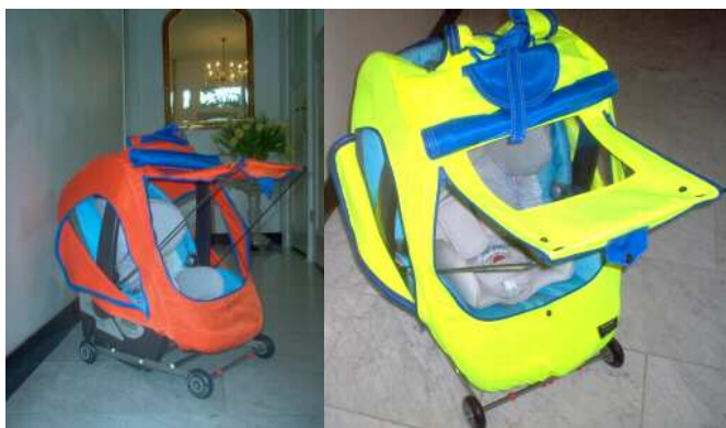
Babybike shelter € 99